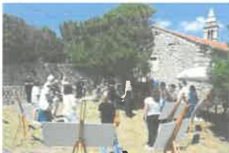
Izložba je postavljena u dvorištu